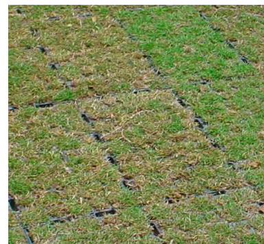
プロテクター接続状況