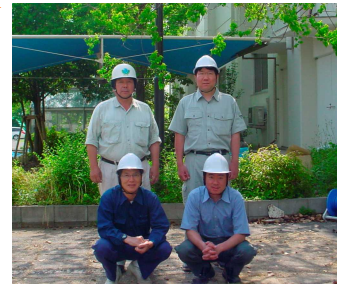
緑化ボランティア