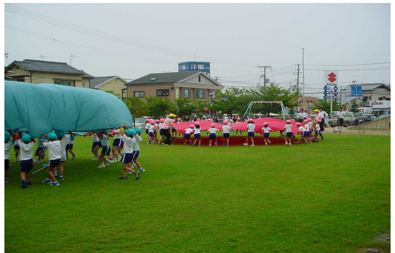
元気に遊ぶ園児たち